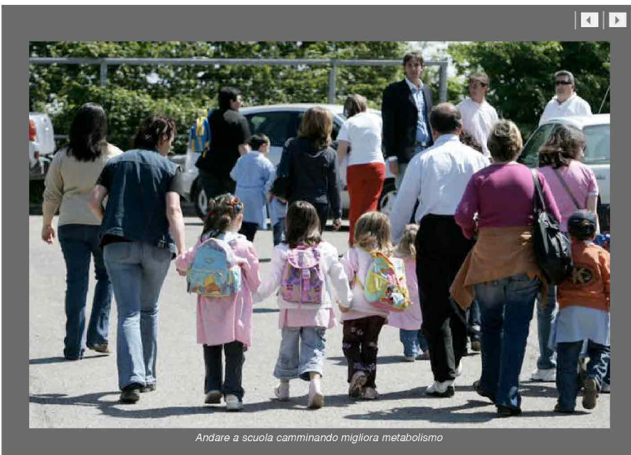
Andare a scuola camminando migliora metabolismo

Indietro Stampa Invia Scrivi alla redazione Suggestisci