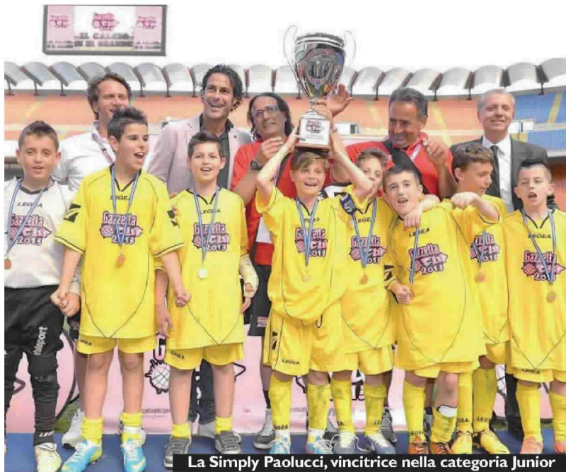
La Simply Paolucci, vincitrice nella categoria Junior