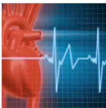
Lo spread fa male al cuore