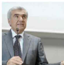
I medici vogliono stare nel "patto"